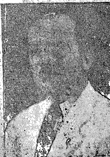
DEMETRIO A. PORRAS